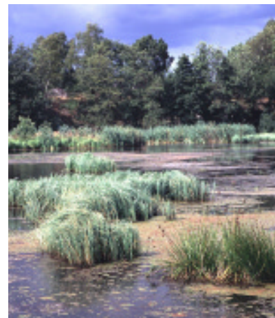
Våtmark Alhagen i Nynäshamn